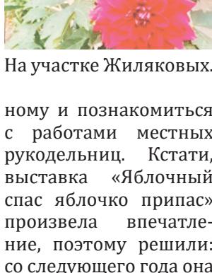
На участке Жилияковых.