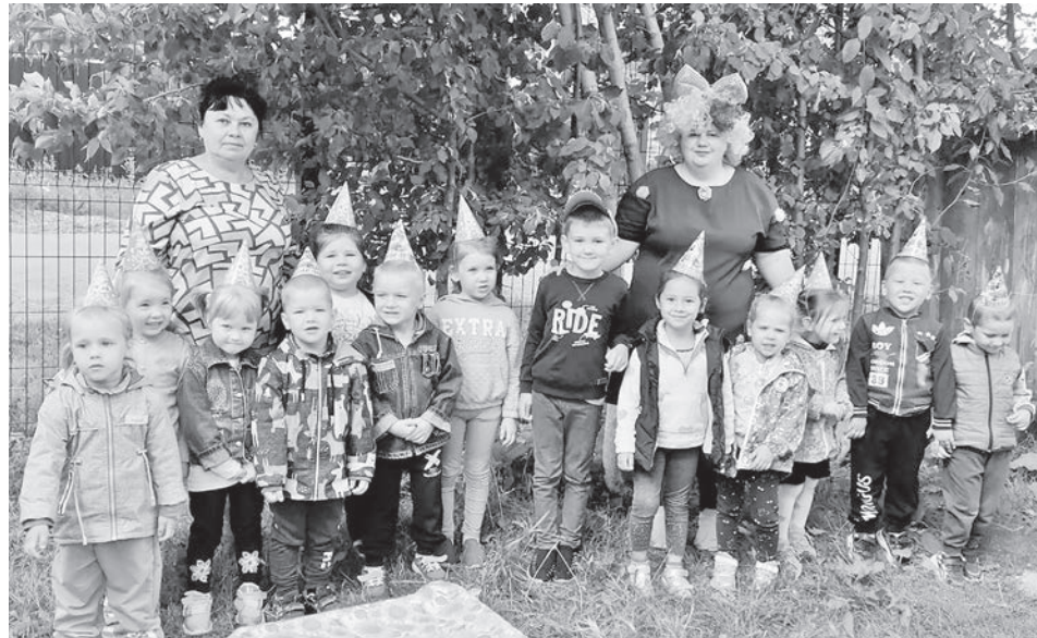
В детском саду «Родничок» прошло развлечение «День именинника».

Так, в нашем ДОУ «Родничок» прошло развлечение для детей «День именинника». В каждой группе есть воспитанники, у которых день рождения летом. И в каждой