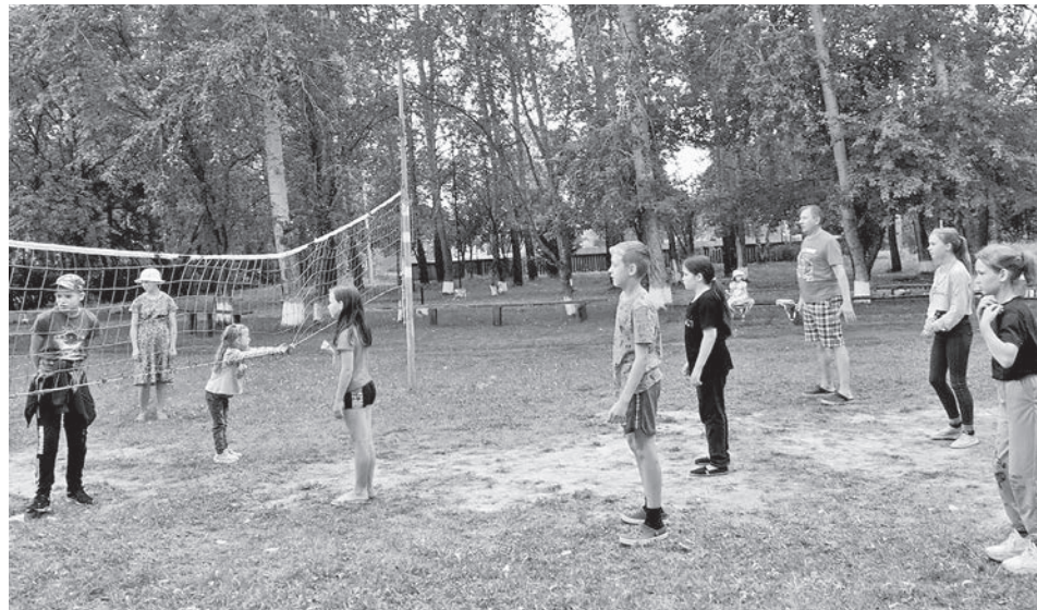
Атмосфера детства, озорства, непосредственности царила на площадке.

Радуется, что с каждым мероприятием подключается всё больше участников.