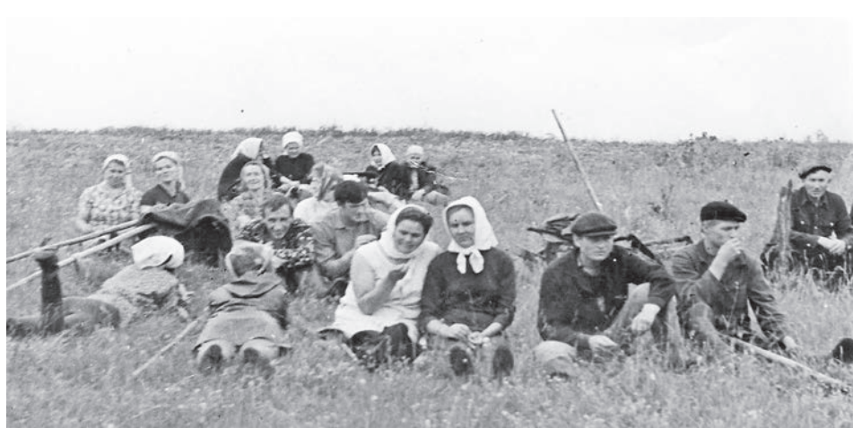
Отдых после работы. 1972 год.

Семьи в основном в селе были многодетные, но не все ребяташки посещали детский сад. Малыши бегали вместе со старшими, те присматривали за