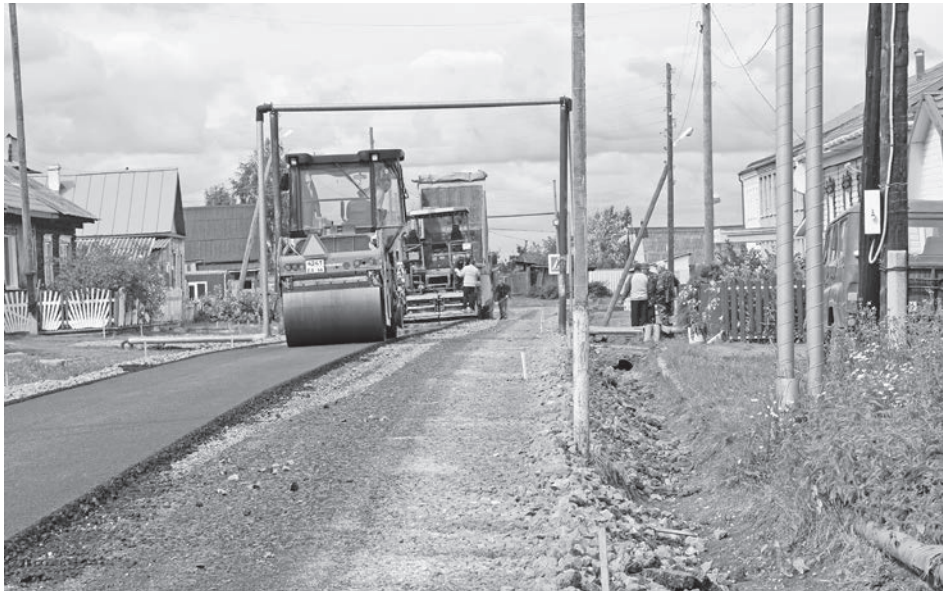
Капитальный ремонт переулка Чкалова в Елани.

После окончания работ мелиостроевцы переезжают в Краснополян-