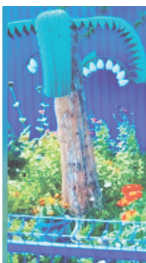
На участке Дунаевых.